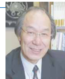
キャリアセンター長(副理事)

まずは自己を分析、理解し適性を知って、進むべき道や可能性に思索をめぐらせ、自己形成を目指し、人生設計を打ち立てる。これがキャリア形成であり、社