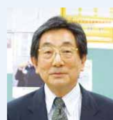
キャリアオーガナイザー

人も資金も情報も不十分で、行き届いた支援は出来ませんが、スタッフ一同あなたと向き合い、心を込めて努めてまいります。よろしくお願ひいたします。