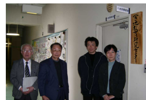
へき研資料室前で