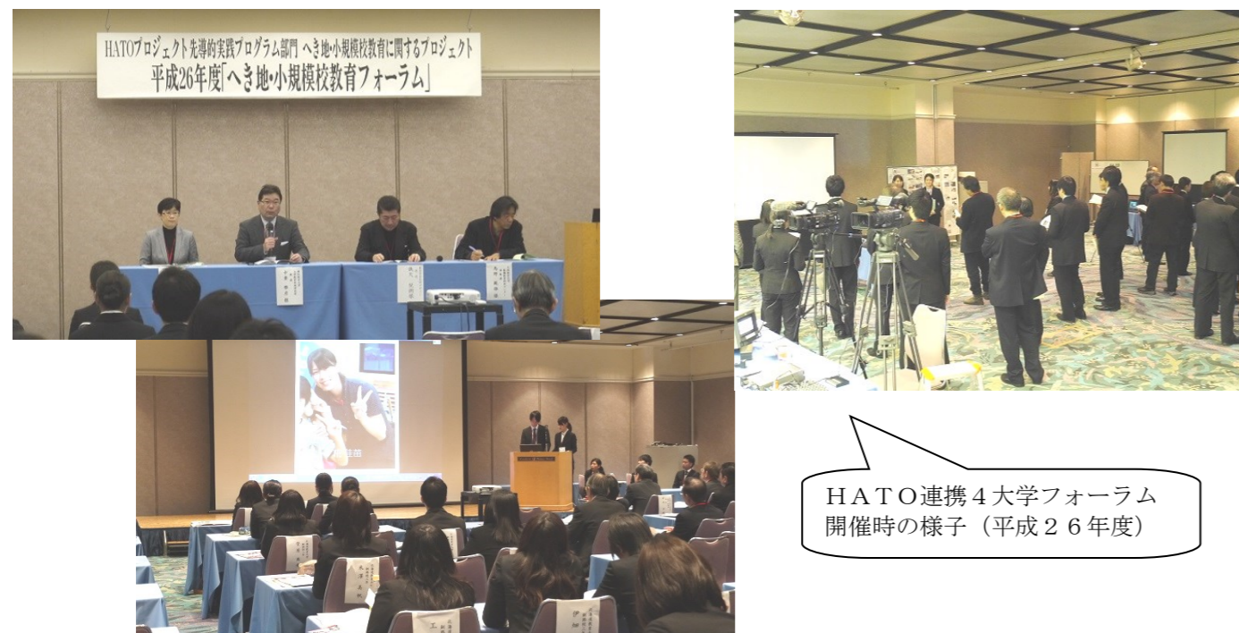
HATO連携4大学フォーラム開催時の様子(平成26年度)

平成28年2月下旬もしくは3月上旬に釧路市にて開催予定です。参加大学には、HATO連携大学の愛知教育大学、東京学芸大学、大阪教育大学のほか、本学と同様にへき地・複式教育実習を行っている和歌山大学にも参加いただく予定です。