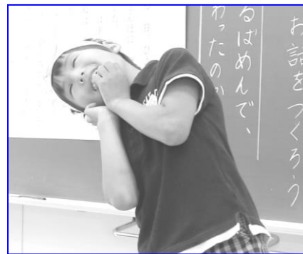
きつねの気持ちを表現している児童の姿

「きつねのおきゃくさま」を読む動機として、単元の後半に「繰り返しのあるお話作り」の活動を位置付け、意欲と視点をもちながら教材文を読むことができるようにした。