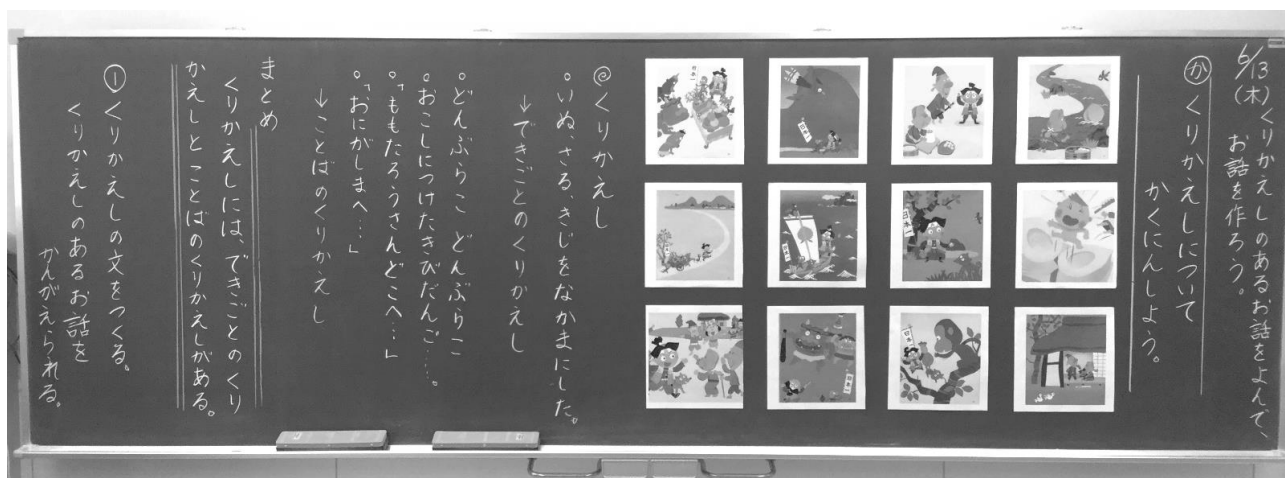
資料7 単元1時間目の板書

繰り返されていることを見付けていた。以上を基に、繰り返しとは、「出来事の繰り返し」と「言葉の繰り返し」があるということをもとめとして押さえた（資料7）。加えて、児童からは「(直前の単元の教材である)『えいっ』も繰り返していたよ。」「(第1学年で学習した)『大きなかぶ』にも繰り返しがあつた。」という発言があり、既習の内容とつなげて考えている様子が見られた。