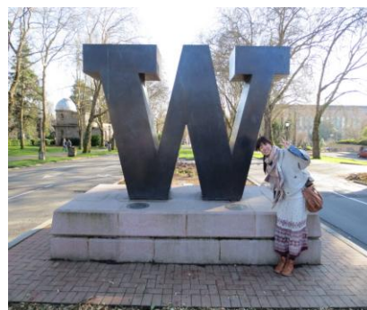
大学正門のシンボル

まず、最初にクラスを 3 つに分けるためのリスニングテストと先生との簡単な面接がありました。その結果でクラスが分けられ、そのクラスごとに授業内容も異なるものでした。私のクラスでは、テキストを用いた文法学習、