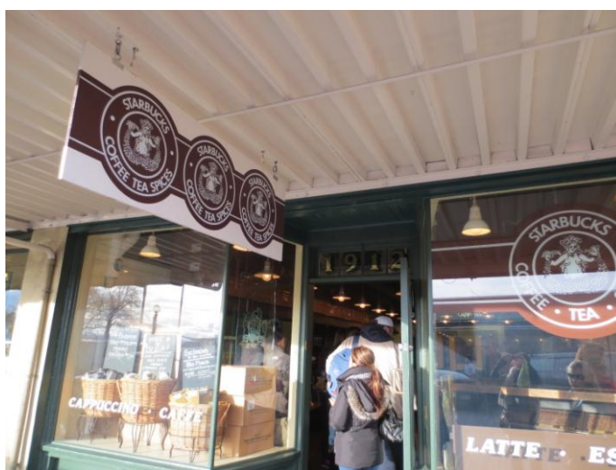
ダウンタウンにある スターバックス1号店