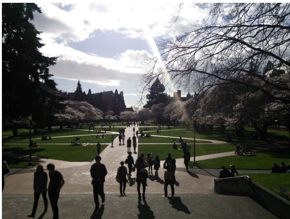
ワシントン大学。桜が咲いていた

日本に帰って来て、シアトルのことを思い浮かべると行ってよかったなと思える思い出ばかりです。シアトルでの3週間は英語を学べ、たくさんの人と交流でき、観光もできる濃い時間でした。興味がある人は是非参加してください。後悔はしないと思います。