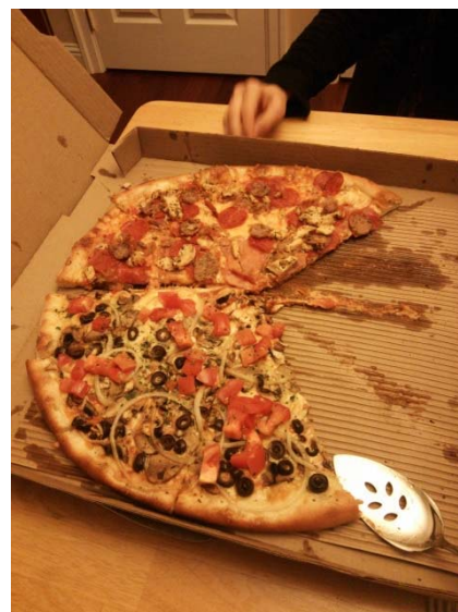
ファミリーと食べたピザ