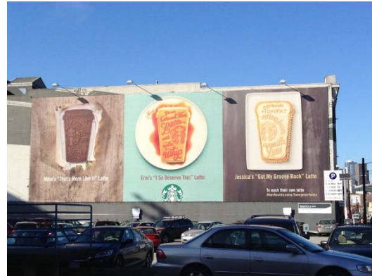
※4 スターバックスコーヒーの広告