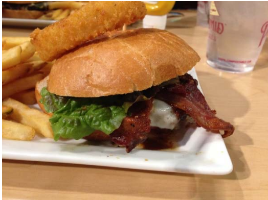
※3 ハンバーガーショップにて