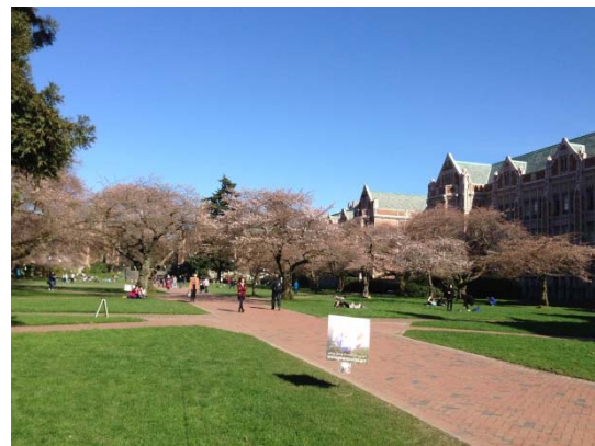
※2 キャンパス内にある桜