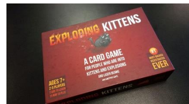
アメリカで流行したカードゲーム

私たちの Language and culture クラスでの授業内容を一部紹介します。主に、授業時間は9:30~12:00までで午前中には授業を終えます。その短時間にホームステイ先で疑問に思ったこと、アメリカ(シアトル)の暮らしの中で日本と異なる点など質問したり、アメリカで流行しているカードゲームを説明書から自分たちで理解し実際に行ってみたりなどクラスの人と楽しく英語使って交流する場が