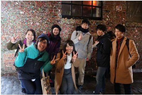
Gum Wall と北教大の一部の皆さん

右の写真はシアトルで最も不衛生な悪名高い観光スポット Gum Wall。その光景はまさに disgusting という表現に適した場所でした。先ほど紹介したフィールドトリップの他に何もない平日の午後や休日を使って様々なところにいってみるといいと思います。土日を使ってカナダへ行く人もいました！いろんな場所にいって、見て、たくさんの初めての体験ができると思います。