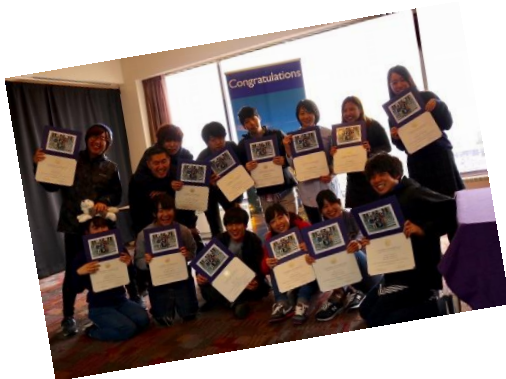
Language and culture クラスでの1枚

私がこの研修に参加した理由は英語能力向上と異文化理解の学習でした。具体的にいうと、現地の人々との交流を楽しみ、様々なところに実際に行きアメリカでの生活を体験、学習するというものです。私はこれらのことを全て達成できると思っていました。しかし、現実には甘くはありません。留学中、留学後もっと英語を勉強しておけば良かったとつくづく思いました。だからこの研修を考えている皆さんにはぜひ英語を勉強し listening と speaking の練習をすることをオススメします。しかし、私はこの研修で何も得られなかった訳ではありません。私はこの研修でまだ私の経験したことのないことがあると強く感じました。また、英語をもっと勉強して英語圏の各地に行ってみたいと思うことができました。ぜひこの研修に参加して様々な体験をしてみてください！