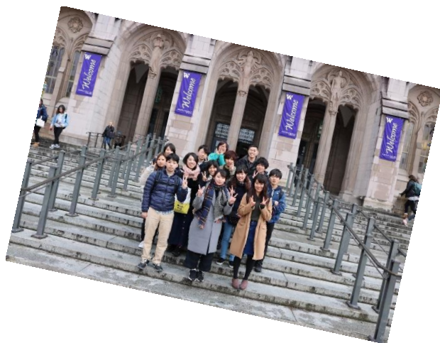
図書館前でのクラス写真