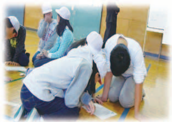
写真1 グループでの話し合い活動

今回の話し合いでは、チームが円状になり仲間の顔を見て話すことや、「話し合いのルール」を指導した。このルールは、1人1回以上発言することや自分が発言するとき、仲間の発言を聞くときのマナーをまとめたものである。その結果、前時に比べてチーム全員が話し合いに参加している様子が見られた。その結果、その後の活動では、両チームからボールの回数をカウントする声が生まれていた。さらに、ゲームが終わった後のチームの反省でも、話し合いのルールは徹底できていた。「たくさんパスを回す」というチームのめあてに対しては、両チーム共にまだ未達成と認識していた。