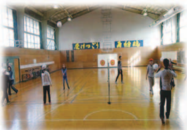
写真5 チーム練習の様子

練習のなかでは、チームのめあてを「間のボール、後ろにきたボールをしっかり取る」としていた2班の児童で、円陣パスの際に「間のボールの練習をしよう」という、チームのめあてに対しての練習を行おうとする活動がみられた。