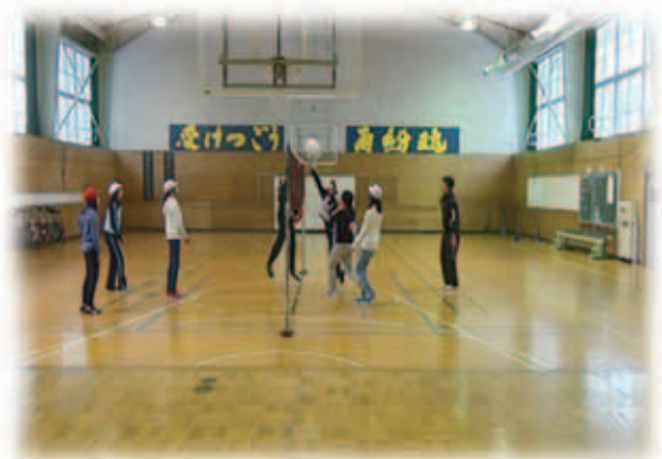
写真4 ゲームの様子

ゲームでは、これまで仲間あまりパスを出す場面が見られなかった男子児童たちからも、ボールをうまくコントロールしてパスを出している姿が見られ、チーム全員がボールに触れる回数が、それまでの授業のなかで1番多かった。また、チーム内でパスがつながることで、一体感が生まれ、チームの雰囲気は向上し、ゲームのなかでのよるこびの声や、励ましの声が自然と出ていた。