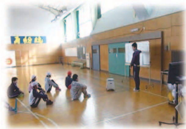
写真2 全体で課題の確認

前時に児童から出た「チーム替えを行いたい」という訴えに関しては、まず、授業者から見て両チームにそれほど戦力差がないということを説明した。次に、前時の授業のなかで、2班のメンバーが練習中にボールをぶつけあっている場面を映像で見せ、児童たちに「どうしてこうなってしまったのだろうか」という発問を行った。