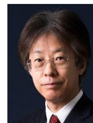
北海道教育大学長