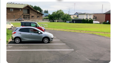
駐車場も広くなり使いやすく