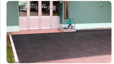
正面玄関の段差が解消