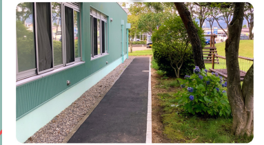
歩道も広くなり歩きやすく