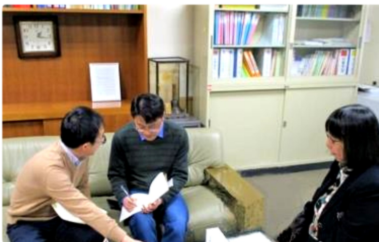
へき地教育について聞き取る中国研究者

両研究者の目的は、中国において農村教育振興が大きな課題となっており、その振興のために日本のへき地教育研究から学びたいとのことでした。特に中国では、都市部と農村部の教育格差は激しく、農村の発展施策が国家政策としても重要になっているとのことでした。