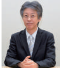
北海道教育大学長 蛇穴 治夫

hue pocket (ヒューポケット)は、北海道教育大学がキャンパスの中に閉じこもっているのではなく、全学をあげて外に向かって飛翔していく象徴です。小さなポケットにはたくさんの夢が詰まっています。アクセスの便利な本サテライトをぜひ活用ください。