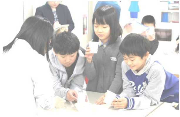
【よりおいしいみそ汁について考える児童の様子】

本時では、よりおいしいと感じるみそ汁の味について、比較を通して考える場面を2度設けました。導入では、だし有りとしだし無しのみそ汁を味見により比較し、どちらをおいしいと感じるのかについての考えを交流しました。だしの味を好む児童もいれば、だしの味を好まない児童もいましたが、だしによって風味が変わることを、共通理解することができました。展開場面では、だしの味を更に細分化し、煮干し、昆布、かつお節の単一だし汁と、3種類を合わせた混合だしを味見して比較し、おいしいと感じる味を見付ける活動を通して、だしによる風味の違いを感じ取る場面を設けました。1時間の中で複数回の比較を設定し、おいしいと感じるみそ汁について考えたことで、自分にとっておいしいと感じる味は、家庭の味に近いものなのか、家庭の味と異なるものも好むのかを知らながら学習を進めました。みそ汁の味を比較する活動を通して、児童はおいしいと感じる味には正解がないことに気付き、だしや実、みそ、水等を工夫して風味を変化させ、様々なみそ汁を作り、味わいたいという考えをもちました。