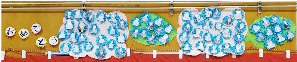
4年生～卒業生の似顔絵とお祝いの気持ちを体育館の壁面に