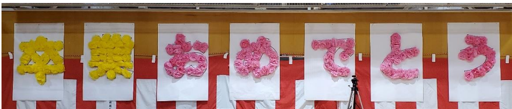
5年生～お花紙を使って感謝とお祝いの気持ちを壁面に