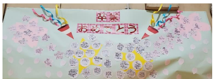
3年生～ありがとうのメッセージを体育館入り口に