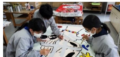
スポ祭に向けて準備も一生懸命

今年度のスポーツ祭でも本校が育てたい子供の姿である「期待に胸をふくらませ、やり遂げた喜びに心をおどらせる」様子をお見せできることと思います。子供たちが試行錯誤しながら一生懸命考え、頑張る姿をぜひご覧ください。本番当日までお子さんへの励ましや体調管理へのご配慮など、変わらぬご支援・ご協力をどうぞよろしくお願いいたします。