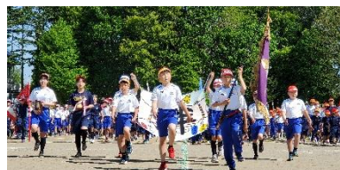
前哨戦の入場行進 ~本番もがんばるぞ!~