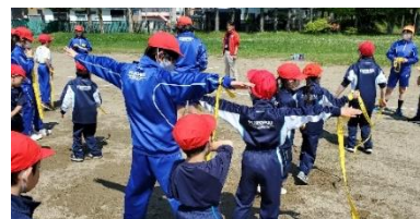
高学年は、低学年のサポートもバッチリ