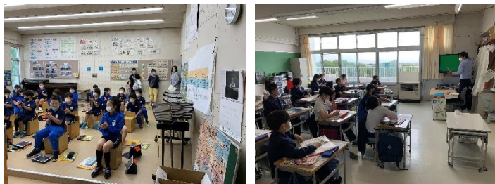
全体説明会の様子