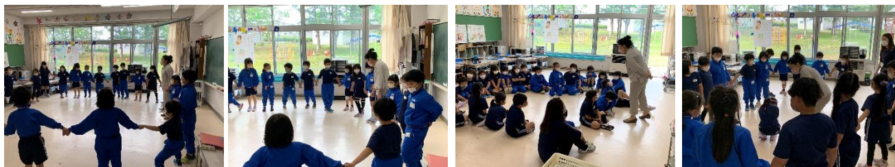
すてきな歌声と楽しい遊びにふれることができました

★ゲストティーチャープロジェクトの取組です。7月6日(水)に、1年生で「わらべうた」を教えてくださいました。ありがとうございました。