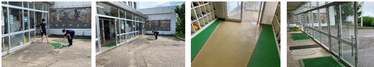
玄関の床をピカピカにしてくれました

特に6年生は、玄関先の清掃を念入りに行ってくれました。前期課程の最上級生として、「学校を代表する」役割と責任を果たしてくれています。