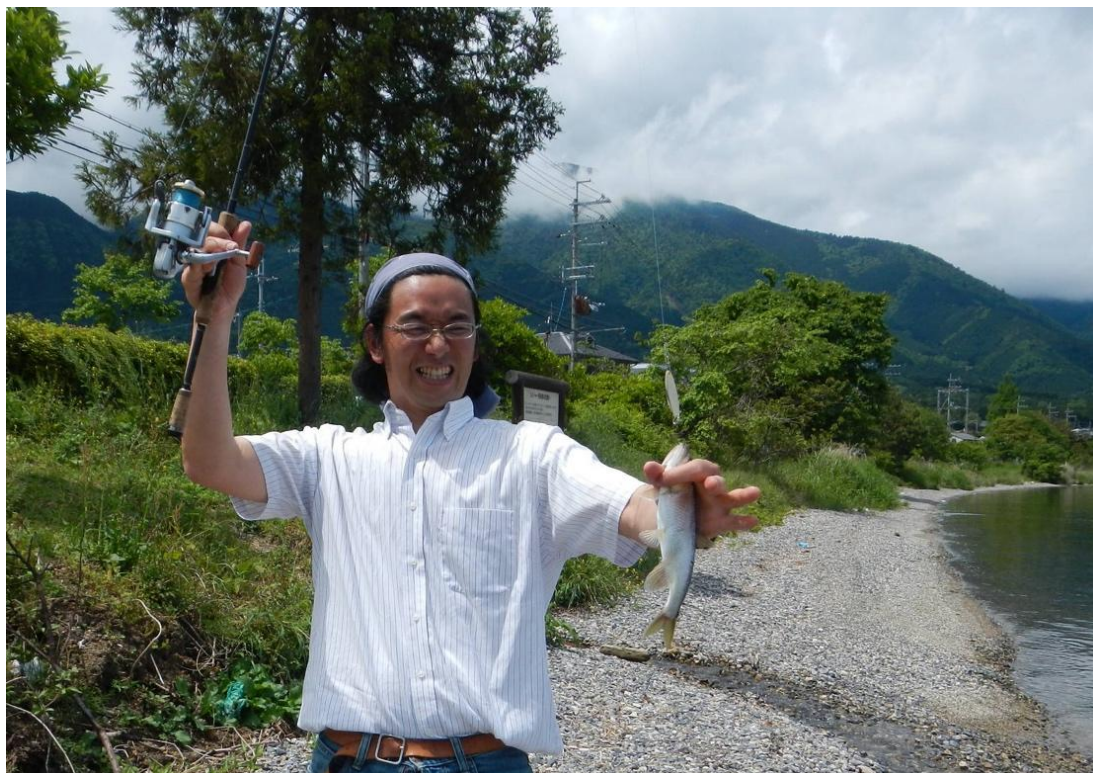
琵琶湖西岸の砂礫底の地点で釣り上げたオスのハス。ハスの口元には使用したスピナー型のルアー（Myran社製）が写っている。